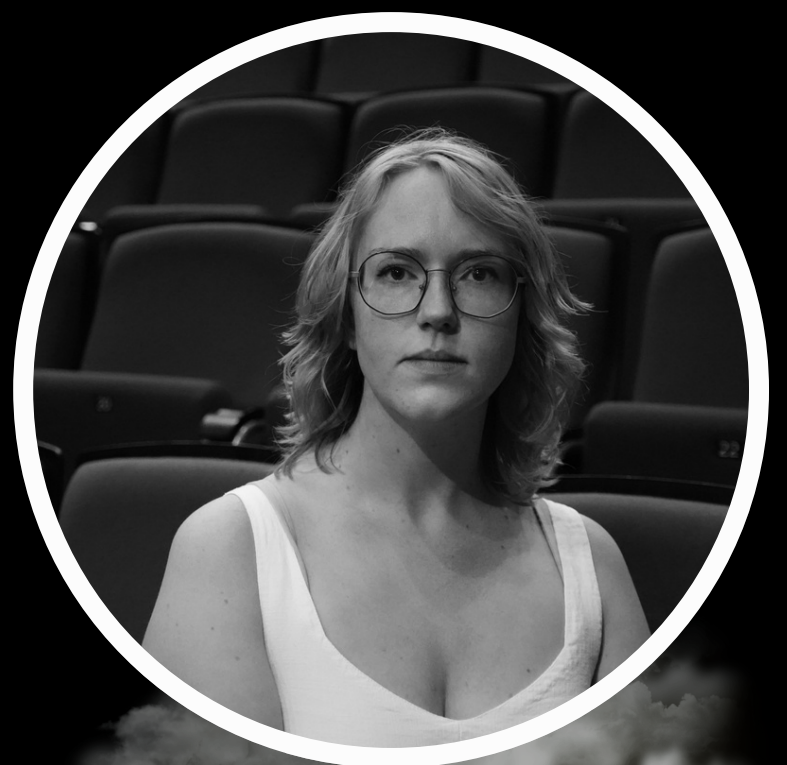
FINTE BOTS Ik vergeet je - The scarlet pimpernel